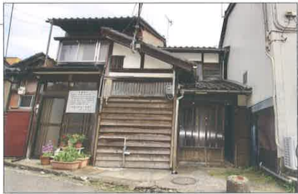
写真上は、奈良県の古家で購入価格 218 万円、表面利回り 14.61%。 写真下は、石川県金沢市の古家で販売希望価格 250 万円を価格交渉 で 100 万円まで下げてもらいました。表面利回りは 15.70%です。

相場 500万円〜700万円、 リフォーム費用の相場 300 万円〜500万円、家賃相場 8 万円〜10万円、平均表面利回り 12〜15%。多くの企業、大学、商 業施設がある。