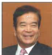
全国賃貸管理ビジネス協会名誉会長