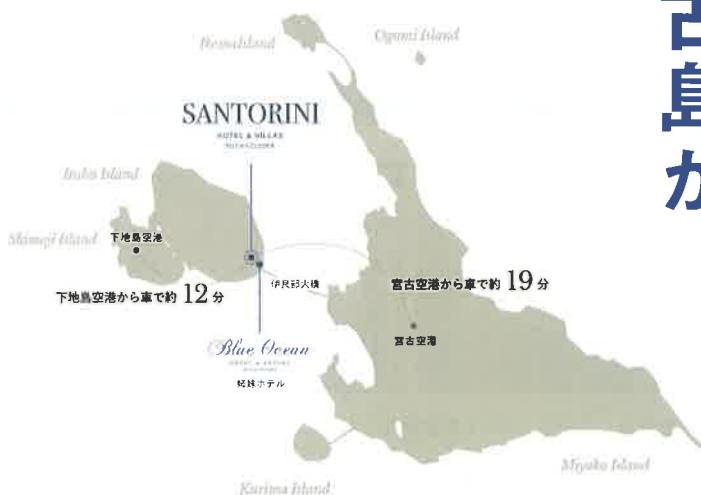
▲サントリーニ ホテル & ヴィラズ 宮古島は、宮古空港から車で約19分。下地島空港から車で約12分の場所にあり周辺の観光にも便利な立地となっています